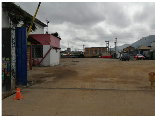
Foto No. 1. Fachada del predio.