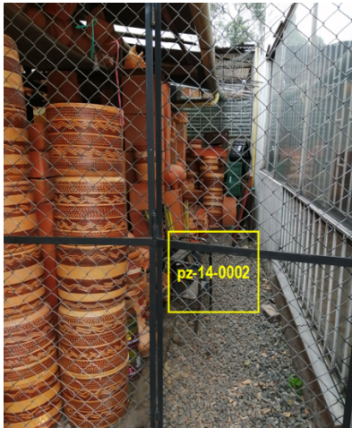
Foto No. 3. Vista general del pozo.