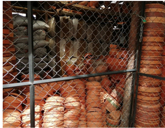
Foto No. 4. Área de almacenamiento de materas.