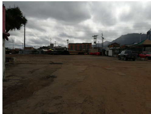
Foto No. 2. Vista general área de parqueadero.