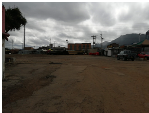
Foto No. 2. Vista general área de parqueadero.