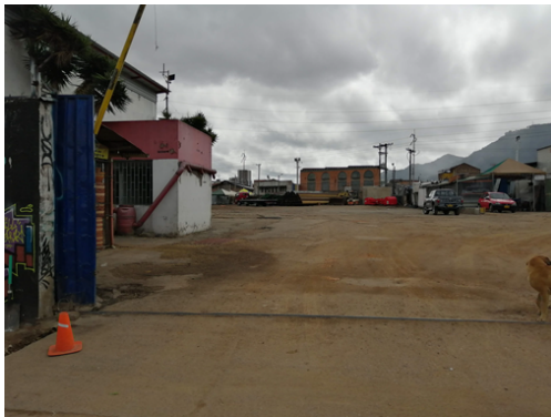
Foto No. 1. Fachada del predio.