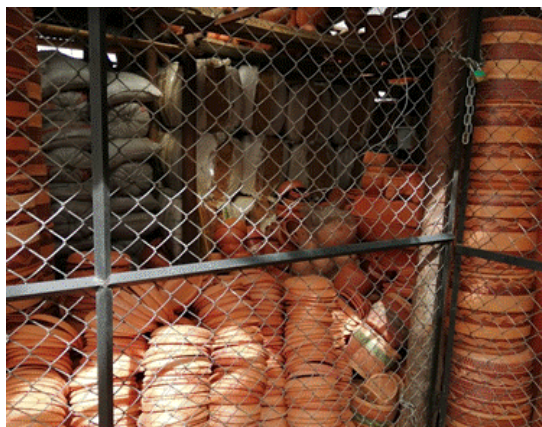
Foto No. 4. Área de almacenamiento de materas.