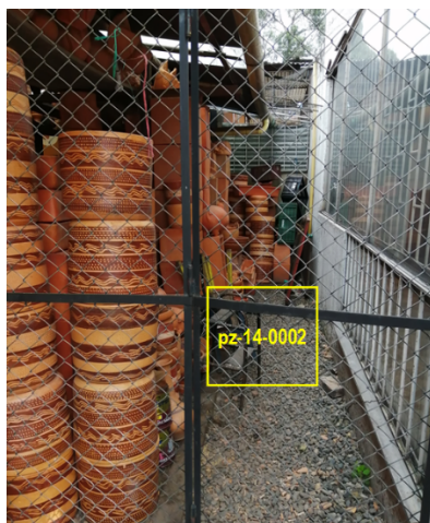
Foto No. 3. Vista general del pozo.